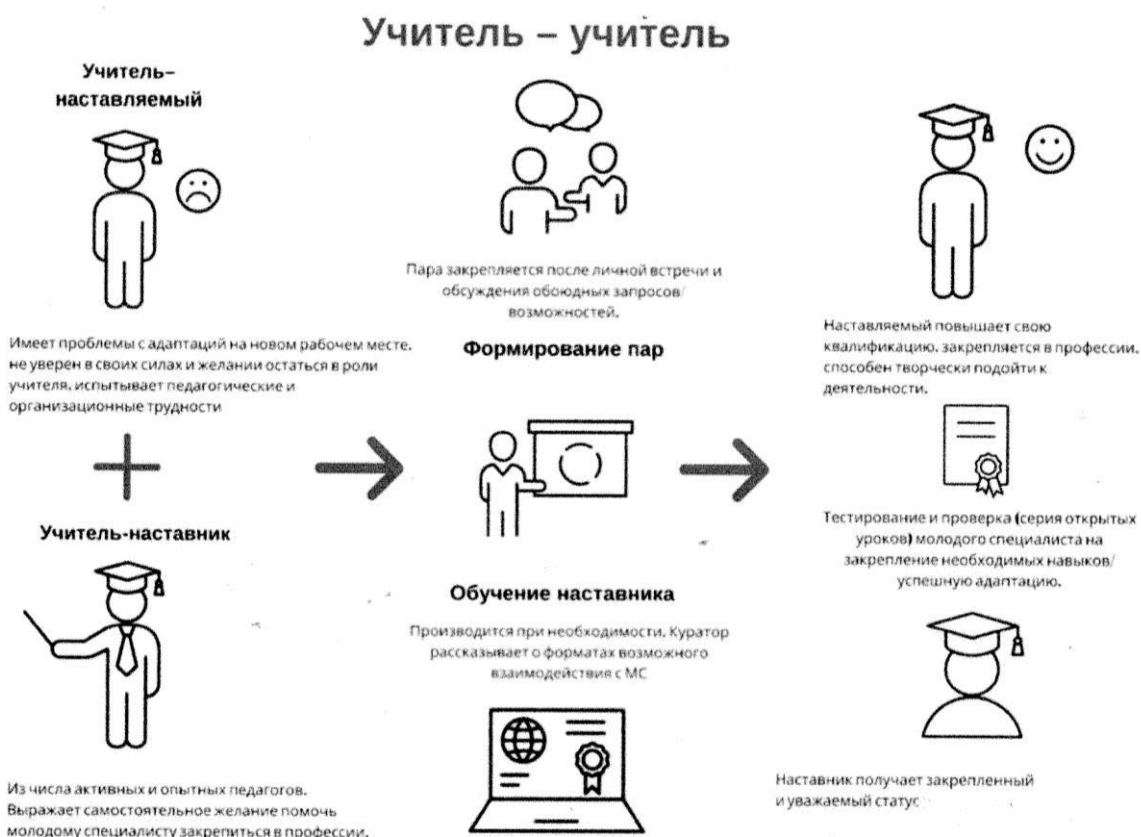
Рис.1 Форма наставничества «учитель – учитель»

Формы и методы работы с молодыми и новыми специалистами: беседы; собеседования; тренинговые занятия; встречи с опытными учителями; открытые уроки, внеклассные мероприятия; тематические педсоветы, семинары; методические консультации; посещение и взаимопосещение уроков; анкетирование, тестирование; участие в различных очных и дистанционных мероприятиях; прохождение курсов.